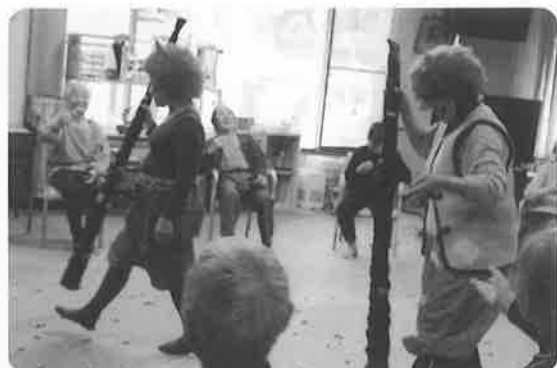
迫力あるオニの登場!!