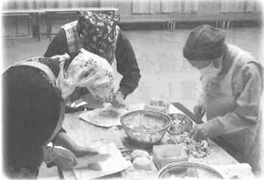
真剣に切ってます?