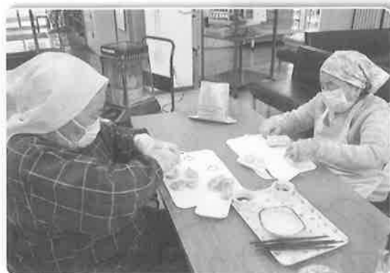
みなさん手慣れた手つきです?