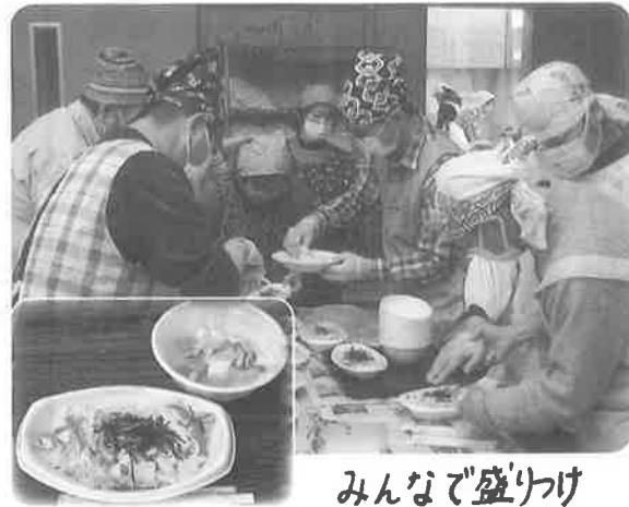
みんなで盛りつけ