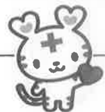
日本赤十字社マスコットキャラクター ハートラちゃん

被災されました皆様に心よりお見舞い申し上げますとともに、多くのご支援、ご協力ありがとうございました。