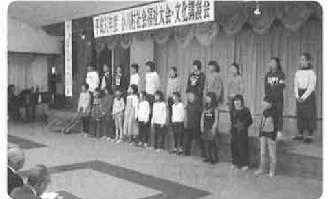
小川小学校合唱団