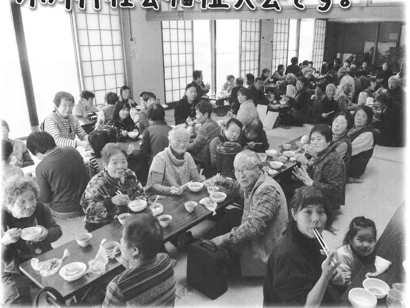
小川村社会福祉大会を開催 - 関連記事4.5ページ (写真は昼食会場の様子)