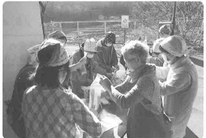
炊き出し実演 寒いのにありがとなえ

社会福祉大会にご協力いただき ました、ボランティアをはじめとする、すべての 皆様に感謝申し上げます。