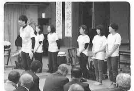
小川村盛り上げ隊のみなさん

がたさや愛おしさを 感じた。"故郷"小川 村への思いが、何か 貢献したい。そんな 小川村盛り上げ隊を 結成されたそう。和 太鼓があるそうです。 果敢があるそうで、 当日は実際に会 場から数名が和 太鼓演奏を体験 しました。会場 が一体となり、 和やかな雰囲気 の講座となりました。 期待したいです