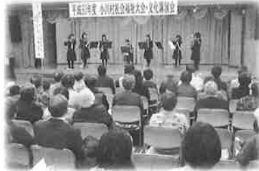
小川中学校 吹奏楽部