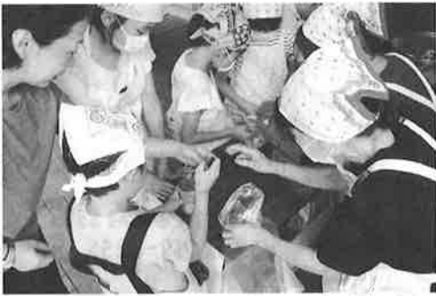
初めて缶切りを使って缶詰を開けることに挑戦!