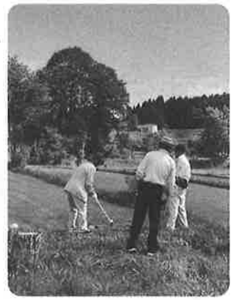
七月十日 大洞高原 マレットゴ ルフ場にて 老人クラブ

連合会主催のマレットゴルフ大会 が開催されました。 当日は老人クラブ会員以外の 参加者も多く、爽やかな高原 でプレーを楽しみ、健康増進と 交流親睦を 深めました。