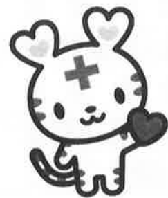
日本赤十字社キャラクター