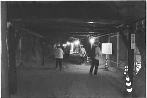
資料館で大本営地下壕の歴史を勉強したよ