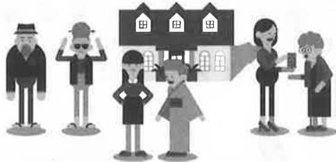
社会福祉大会の開催 ボランティア推進事業