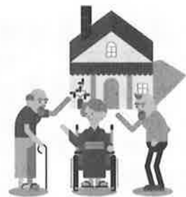
高齢者を対象にした 音楽療法

引き続き、12月31日まで募金 を受付けています。ご協力よろし くお願いします。