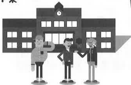
小・中学生の福祉・ボラン ティア活動推進事業