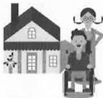
障がい者社会参加事業