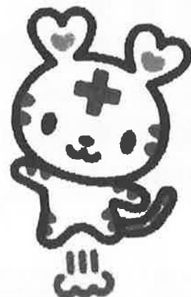
日本赤十字社キャラクター ハートラちゃん