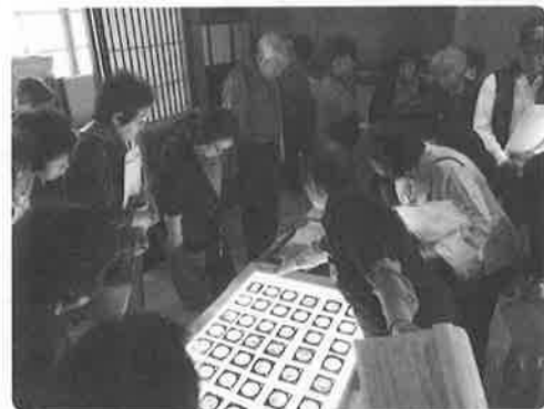
歴史資料館には貴重な資料が展示されています