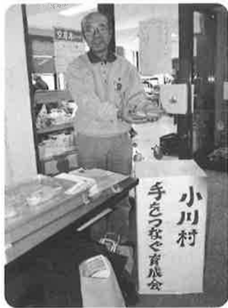
小川村手をつなぐ育成会 による福祉バザー

福祉バザーのお礼 今年も皆様からたくさん品の物を提供 いただきました。売り上げ金は全額、障 がいをもつみなさんの福祉向上を図る 財源とさせていただきます。ご協力あ りがとうございました。