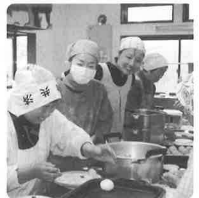
家族のようなふれあいに 自然と笑顔がこぼれます。

以前、利用されていたご家 庭で、お弁当箱があれば、サ ンリングまで返却していただ きますようお願いいたします。