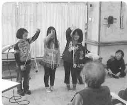
参加者からの感想